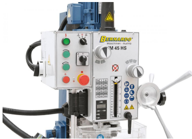
Übersichtlich angeordnete Schaltelemente (Gewindebohren, Start-Stop,...)