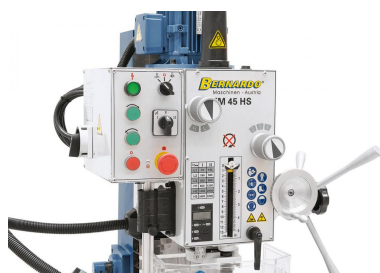
Übersichtlich angeordnete Schaltelemente (Gewindebohren, Start-Stop,...)