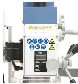
Digitale Pinolenhubanzeige für komfortables Arbeiten.