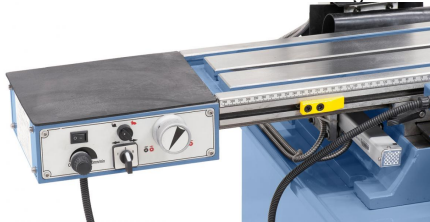
Für erhöhten Bedienkomfort serienmäßig mit stufenlos regelbarem Frästischvorschub FTV 6