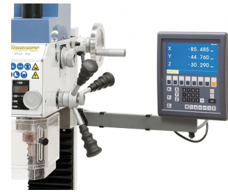
Serienmäßig mit Digitalanzeige in x-, y- und z- Achse.