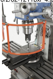
Optional lieferbar: Ausdrehkopf diam. 75 mm und Weitspannschraubstock FJ 125