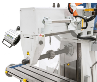
Serienmäßig mit Gegenlager und langem Fräsdorn für horizontale Fräsarbeiten