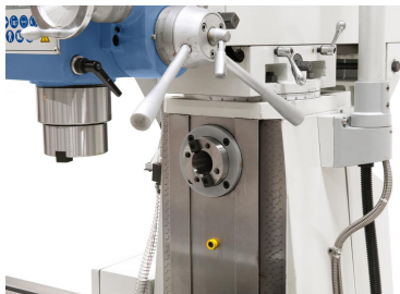
Erweiterte Anwendungsmöglichkeiten durch die Horizontalspindel