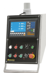
Durch die digitale Positionsanzeige in 3 Achsen wird eine Produktivitätssteigerung bis 50% erzielt. Benutzerfreundliche Anordnung der Schaltelemente am Hängepaneel.