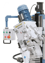
Beidseitig schwenkbarer Fräskopf von -60^\circ bis +60^\circ .