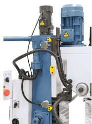
Fräskopfverstellung erfolgt unkompliziert mittels serienmäßigem Hubmotor