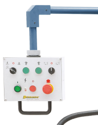
Schwenkbares Bedienpult mit ergonomisch angebrachten Schaltelementen