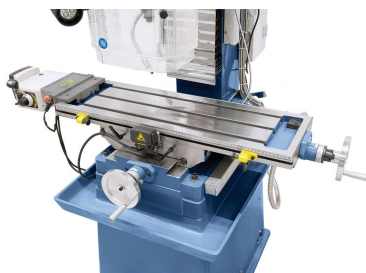
Großdimensionierter Kreuztisch mit T-Nuten und Kühlmittelrinne. Abbildung mit optionalem Frätschvorschub AL 450 D.