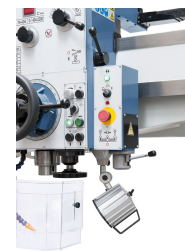
Drehrichtungsänderung bzw. Ein- und Auskuppeln der Spindel erfolgt mittels Pilotschalter an der Unterseite des Bohrkopfes