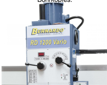
Die Einstellung der gewünschten Drehzahl bzw. des Vorschubs erfolgt an der Vorderseite des Bohrkopfes.