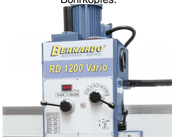
Die Einstellung der gewünschten Drehzahl bzw. des Vorschubs erfolgt an der Vorderseite des Bohrkopfes.