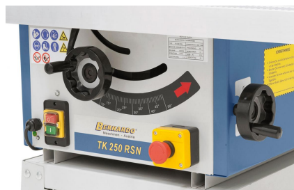
Die Verstellung des Sägeaggregats erfolgt durch ergonomisch angebrachte Handräder am Maschinenkörper.