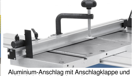
Aluminium-Anschlag mit Anschlagklappe und Niederhalter im Lieferumfang enthalten.