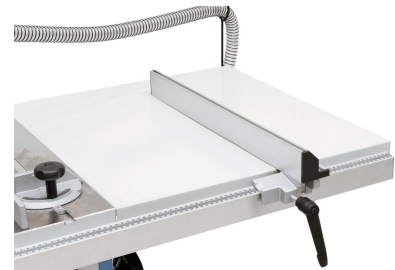
Tischverbreiterung für Schnittbreiten bis 700 mm im Lieferumfang enthalten.