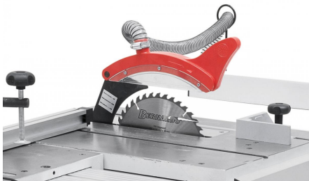
Der Sägeblattschutz mit integriertem Absaugstutzen ist am Spaltkeil befestigt.