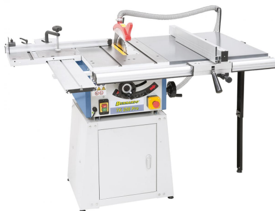
Abbildung TK 250 PRO mit optionalem Rolltisch, Tischverbreiterung und geschlossenem Untergestell

Die Tischkreissäge TK 250 PRO ist eine in der Grundausstattung kostengünstiges Modell für schnelles Bearbeiten von kleinen Werkstücken. Durch das umfangreiche Sonderzubehör (Rolltisch, Tischverbreiterung, offenes und geschlossenes Untergestell) kann dieses Modell individuell an die eigenen Bedürfnisse angepasst bzw. jederzeit problemlos erweitert werden.