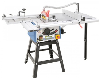
Symbolfoto mit optionalem Rolltisch, Tischverbreiterung und offenem Untergestell