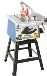
Symbolfoto Basismodell mit offenem Untergestell