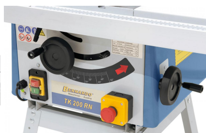
Die Verstellung des Sägeaggregats erfolgt durch ergonomisch angebrachte Handräder am Maschinenkörper.