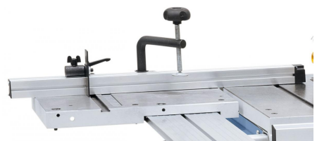
Aluminium-Anschlag mit Anschlagklappe und Niederhalter im Lieferumfang enthalten.