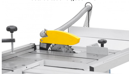
Der Sägeblattschutz mit integriertem Absaugstutzen ist am Spaltkeil befestigt.