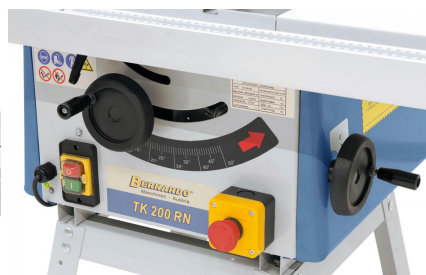
Die Verstellung des Sägeaggregats erfolgt durch ergonomisch angebrachte Handräder am Maschinenkörper.