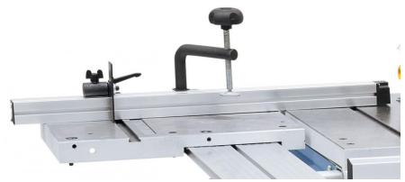
Aluminium-Anschlag mit Anschlagklappe und Niederhalter im Lieferumfang enthalten.