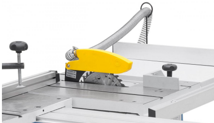
Der Sägeblattschutz mit integriertem Absaugstutzen ist am Spaltkeil befestigt.