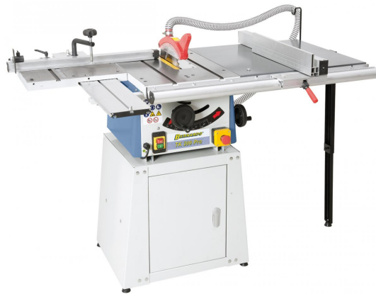
Abbildung TK 200 PRO mit optionalem Rolltisch, Tischverbreiterung und geschlossenem Untergestell

Die Tischkreissäge TK 200 PRO ist eine in der Grundausstattung kostengünstiges Modell für schnelles Bearbeiten von kleinen Werkstücken. Durch das umfangreiche Sonderzubehör (Rolltisch, Tischverbreiterung, offenes und geschlossenes Untergestell) kann dieses Modell individuell an die eigenen Bedürfnisse angepasst bzw. jederzeit problemlos erweitert werden.