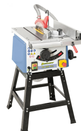
Basismodell mit offenem Untergestell