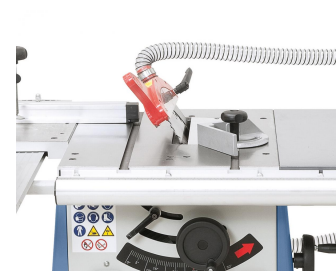
Leichtere Schnittführung des Werkstückes durch das nach links schwenkbare Sägeblatt.