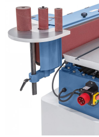
Drei Schleifhülsen zum Konturschleifen im Lieferumfang enthalten.