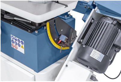
Stufenlos schwenkbares Schleifaggregat für vertikales und horizontales Schleifen.