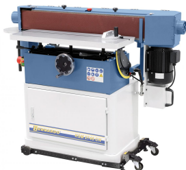
Optional ist eine Fahreinrichtung zum leichten Standortwechsel lieferbar.