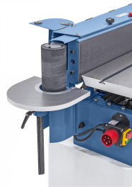
Serienmäßig mit gummierter Schleifwalze.