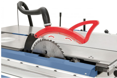
Serienmäßig mit Vorritzaggregat für ein ausreißfreies Bearbeiten von Plattenwerkstoffen.