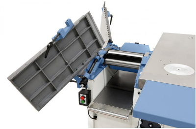
Die hochklappbaren Abrichttische ermöglichen beim Dickenhobeln ein optimales und sicheres Arbeiten, auch bei kurzen Werkstücken.