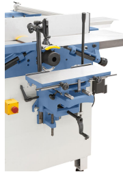
Die serienmäßige Langlochbohrereinrichtung ist ideal für Langlöcher, Dübel- und Schräglochbohrungen,....