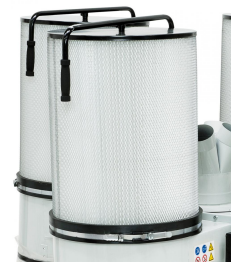
Serienmäßig mit Filterpatronen inkl. Reinigungsbürsten zum Entfernen des Feinstaubes