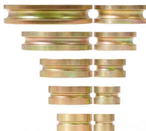
10 Biegesegmente im Lieferumfang enthalten