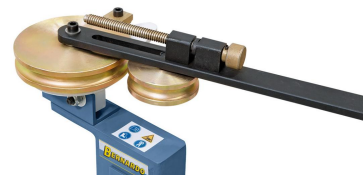
Einfaches Einstellen auf den gewünschten Rohrdurchmesser.