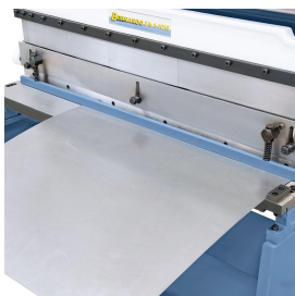
Beim Schneiden wird das Werkstück automatisch geklemmt.