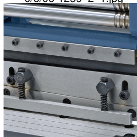
Durch die herausnehmbaren Klavier-einsätze ergeben sich eine hohe Anzahl von Biegemöglichkeiten.