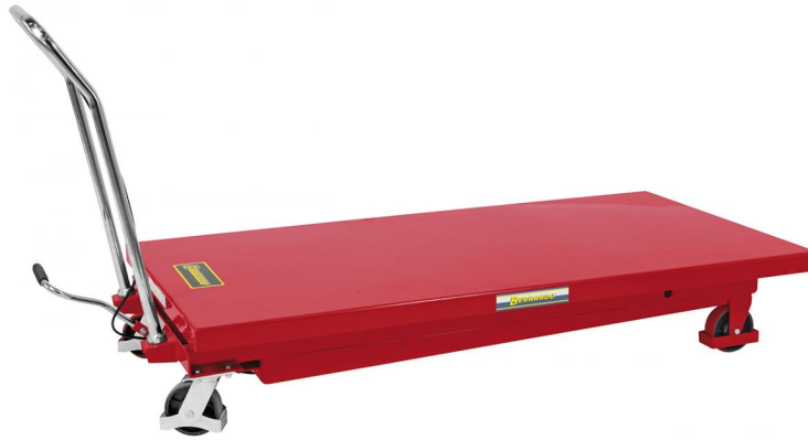
Abbildung TG 500