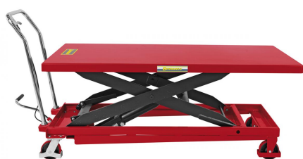
Abbildung TG 500