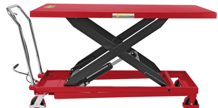
Abbildung TG 500