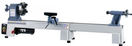
Abbildung mit optionaler Bettverlängerung auf 980 mm.