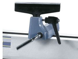
Einfache Fixierung der Handauflage mittels Schnellspannhebel.