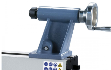
Der kompakte Reitstock wird mittels Einhebeklemmung schnell und einfach fixiert.