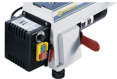
Durch die stufenlose Drehzahlregelung kann die Geschwindigkeit optimal an das Werkstück angepasst werden.