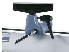
Einfache Fixierung der Handauflage mittels Schnellspannhebel.