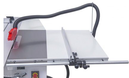
Präzise Führung des Aluminium-Parallelanschlages mittels 25 mm Rundstange.