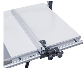
Parallelanschlag mit Schnell- und Feineinstellung für Schnittbreiten bis 900 mm.