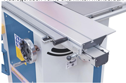
Der verwindungsfreie Formatschiebeschlitten gewährleistet durch die leichtgängige Führung ein präzises Arbeiten.