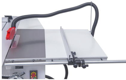
Präzise Führung des Aluminium-Parallelanschlages mittels 25 mm Rundstange.