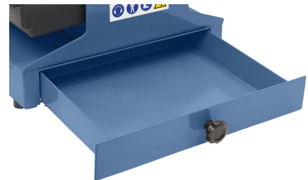
Serienmäßig mit Werkzeuglade zum Aufbewahren des Zubehörs.