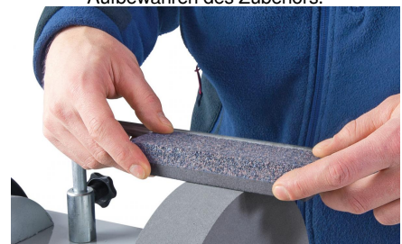
05-2050 Schleifstein: Dient zum Präparieren der Schleifscheibe (fein/grob)