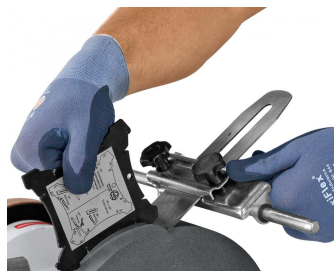
Einfaches Einstellen des optimalen Winkels mit der Winkellehre WL-60 (Standard).