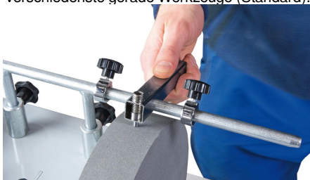
05-2058 Diamant-Abziehvorrättning: Zum kreisrunden und plangenaue Abrichten der Schleifscheibe