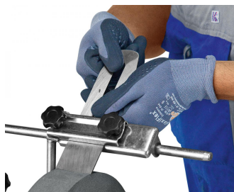
Universalvorrichtung UNI-100, geeignet für verschiedenste gerade Werkzeuge (Standard).