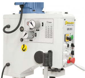
Einfache Bedienung der Schaltelemente für den Drehzahlwechsel.