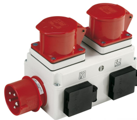
Einschaltautomatik ALV 10: Beim Ein- bzw. Ausschalten der Holzbearbeitungsmaschine wird die Absauganlage mit Zeitverzögerung zu- bzw. abgeschaltet (Option).