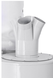
Der serienmäßige Verteiler bietet vier Anschlüsse diam. 100 mm