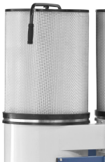
Effektive Steigerung der Absaugleistung durch nachrüstbare Feinstaub-Filterpatrone