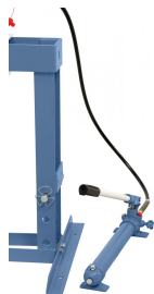
Mit einstufiger Hydraulik-Handpumpe.