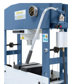
Großdimensionierter Hebel für ein einfaches Zustellen des Druckkolbens.