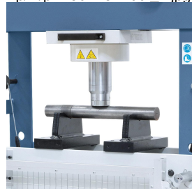
Serienmäßig mit Auflageprisma zum Ausrichten von Wellen