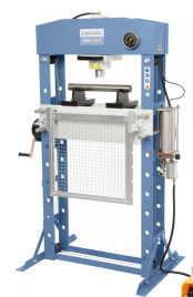
Abbildung mit optionalem Schutzgitter GG-03. Zur Entnahme des Werkstückes kann das Schutzgitter einfach nach unten verschoben werden.