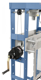
Integrierte Seilwinde für eine einfache Höhenverstellung des Auflagetisches.