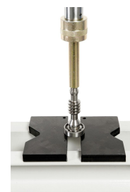
Erweiterter Einsatzbereich durch das optional erhältliche Druckdornset.