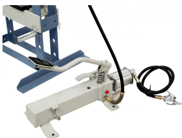
Mit pneumatischer Kolbenverstellung.