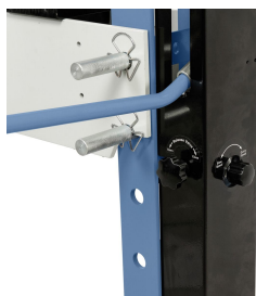
2-stufige Hydraulikpumpe im Lieferumfang enthalten.