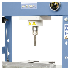
Das optional erhältliche Druckdornset erhöht das Einsatzgebiet zusätzlich.