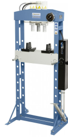
w/k/wk-pwk-h 910 3.jpg