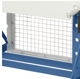
Erhöhte Sicherheit durch optional erhältliches Schutzgitter GG-02.