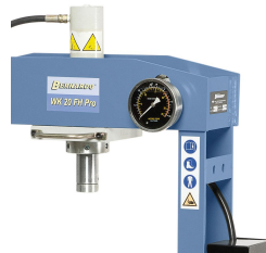
Das Ablesen der Druckkraft erfolgt schnell und einfach mittels Manometer