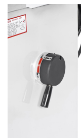
Komfortables Umschalten von Stufe 1 auf Stufe 2