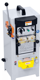
Bandschweißgerät SG 316 separat lieferbar. Antriebener Schleifstein und Schneidvorrichtung im Lieferumfang enthalten.