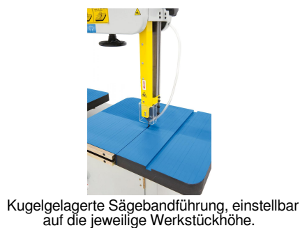
Kugelgelagerte Sägebandführung, einstellbar auf die jeweilige Werkstückhöhe.