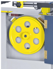
Die dynamisch ausgewuchteten Antriebsräder aus Grauguss sorgen für einen ruhigen Lauf der Maschine.