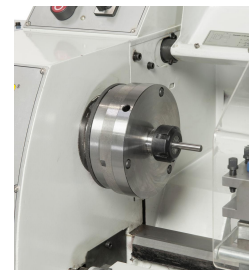
Das Spannzangenfutter ER 25 gewährleistet eine hohe Rundlaufgenauigkeit beim Spannen von Werkstücken, Spannungsbereich 1 - 16 mm.