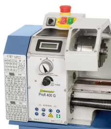
Einfache Vorwahl der Getriebestufe mittels Vorgelege, Einstellen der gewünschten Drehzahl mittels Potentiometer.