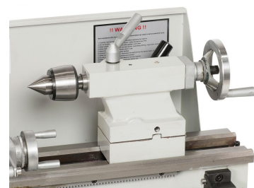
Der Reitstock mit Einhebelklemmung kann zum Kegeldrehen verstellt werden, auf Wunsch mit Körnerspitze lieferbar