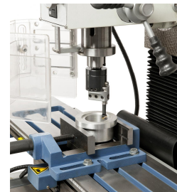
Auf Wunsch kann die Maschine mit einem Ausdrehkopf ausgestattet werden.