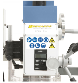
Digitale Pinolenhubanzeige für komfortables Arbeiten.