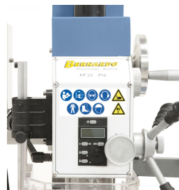
Digitale Pinolenhubanzeige für komfortables Arbeiten.