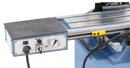
Für erhöhten Bedienkomfort serienmäßig mit stufenlos regelbarem Frästischvorschub FTV 6