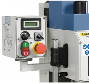
Serienmäßig mit digitaler Drehzahlanzeige und Rechts- Linkslaufeinrichtung