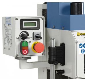
Serienmäßig mit digitaler Drehzahlanzeige und Rechts- Linkslaufeinrichtung