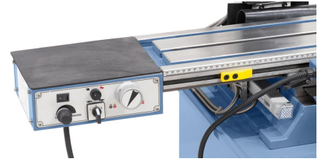
Für erhöhten Bedienkomfort serienmäßig mit stufenlos regelbarem Frästischvorschub FTV 6