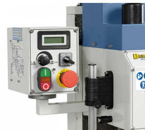
Serienmäßig mit digitaler Drehzahlanzeige und Rechts- Linkslaufeinrichtung