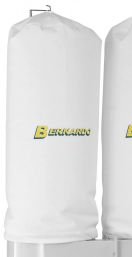
Reduzierter Staubgehalt in der Luft durch speziell gewebte Filtersäcke