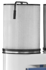
Effektive Steigerung der Absaugleistung durch nachrüstbare Feinstaub-Filterpatrone (Option)