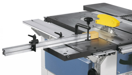
Der Rolltisch aus Grauguss ist plangenau bearbeitet und geschliffen.