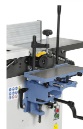
Die Langlochbohrereinrichtung ist ideal für Langlöcher, Dübel- und Schräglochbohrungen