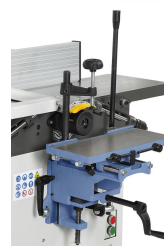
Die Langlochbohrereinrichtung ist ideal für Langlöcher, Dübel- und Schräglochbohrungen