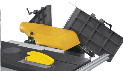
Einfaches und sekundenschnelles Umrüsten vom Abrichten zum Dickenhobeln durch aufklappbare Abrichttische.