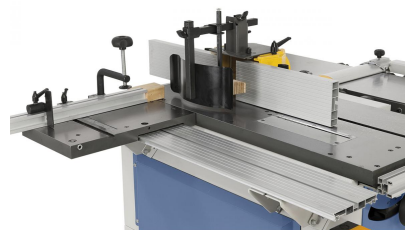
Die solide Fräseschutzhaube kann für Werkzeuge bis 140 mm Durchmesser verwendet werden.