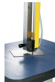
Kugelgelagerte Sägebandführung, einstellbar auf die jeweilige Werkstückhöhe.