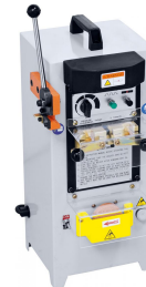
Bandschweißgerät SG 316 separat lieferbar. Angetriebener Schleifstein und Schneidvorrichtung im Lieferumfang enthalten.