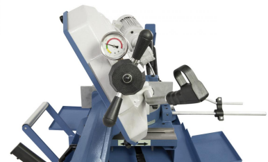
Das serienmäßige Manometer ermöglicht ein optimales Einstellen der Sägeblattspannung.