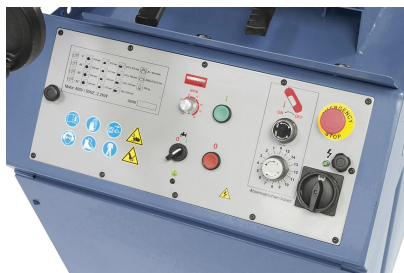
Einfache Bedienung der Schaltelemente am Elektropaneel.