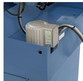
Leistungsstarke Kühlmittelpumpe im Lieferumfang enthalten