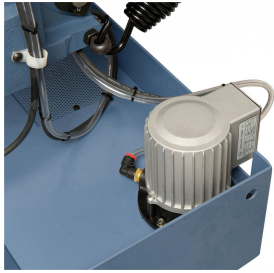
Serienmäßig mit leistungsstarker Kühlmittelpumpe.