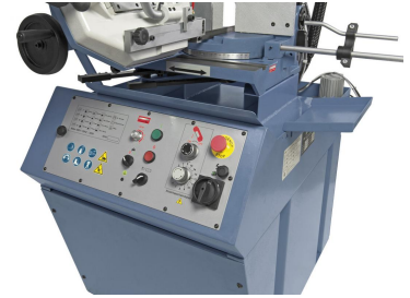
Drehschalter für stufenlose Schnittgeschwindigkeit und Regelventil für den Auflagedruck am ergonomisch angebrachten Bedientableau