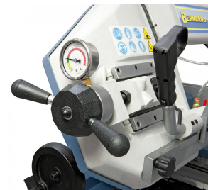
Das serienmäßige Manometer ermöglicht ein optimales Einstellen der Sägebandspannung.