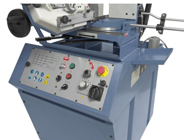
Drehschalter für stufenlose Schnittgeschwindigkeit und Regelventil für den Auflagedruck am ergonomisch angebrachten Bedientableau