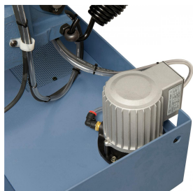
Serienmäßig mit leistungsstarker Kühlmittelpumpe.