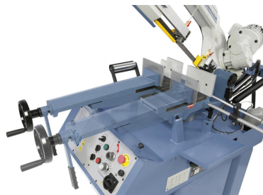
Schnellspannschraubstock zum Doppelgehrungsschneiden verschiebbar.