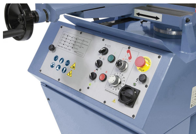
Komfortable Einstellung der Absenkgeschwindigkeit mittels Regelventil.