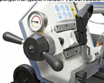
Kontrolle der Sägebandspannung mittels Manometer.