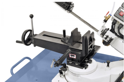
Schwenkbarer Sägebügel zum Gehrungsschneiden von -45^\circ bis +45^\circ verstellbar.