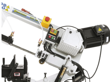
Getriebe mit gehärteter und geschliffener Schneckenwelle, das Schneckenrad ist aus Bronze