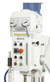
Benutzerfreundliche Anordnung der Schalt- und Bedienelemente am Getriebekopf