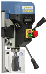
Serienmäßig mit digitaler Drehzahl- und Bohrtiefenanzeige