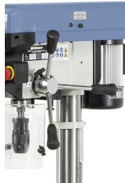
Leichtgängige Pinolenzustellung über ergonomisch angeordnete Handgriffe