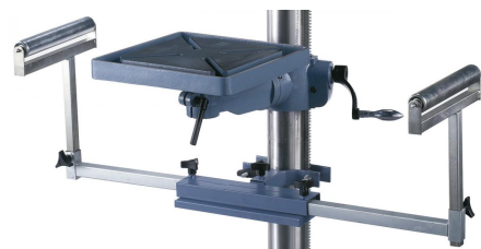
Zum Auflegen von langen Werkstücken kann die Maschine mit einem ausziehbaren Bohrsupport ausgestattet werden.