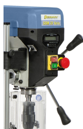
Serienmäßig mit digitaler Drehzahl- und