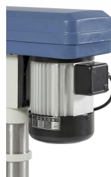
Der hochwertige Aluminium-Motor ist laufruhig und leistungsstark