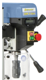
Serienmäßig mit digitaler Drehzahl- und Bohrtiefenanzeige

Zum Auflegen von langen Werkstücken kann die Maschine mit einem ausziehbaren Bohrsupport ausgestattet werden.