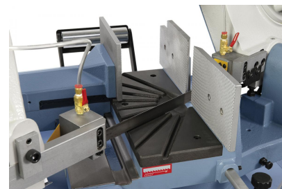
Kugelgelagerte Sägebandführung und Spänebürste für optimale Schnittergebnisse.