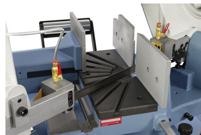
Kugelgelagerte Sägebandführung und Spänebürste für optimale Schnittergebnisse.