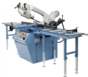
Abbildung mit Rollenbahn, ideal zum Bearbeiten von langen Werkstücken