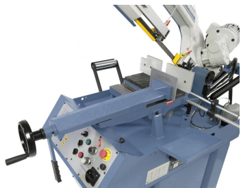
Schnellspannschraubstock zum Doppelgehrungsschneiden verschiebbar.