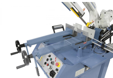
Schnellspannschraubstock zum Doppelgehrungsschneiden verschiebbar.