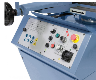
Komfortable Einstellung der Absenkgeschwindigkeit mittels Regelventil.