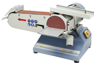
Abbildung mit weggeklappter Abdeckung für große Planschleiffläche.