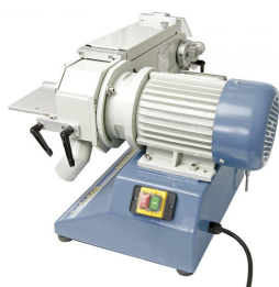
Leistungsstarker Motor und Sicherheitsschalter nach IP54