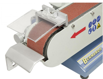
Serienmäßig mit einstellbarer Werkstückauflage und Funkenschutz