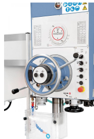
Übersichtlich angebrachte Bedienelemente, die Klemmung des Bohrkopfes erfolgt direkt am Handrad.