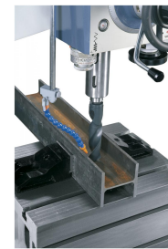
Präzisionsgelagerte Spindel für exakte Arbeitsergebnisse, Würfeltisch und Kühlmittleinrichtung im Lieferumfang enthalten.