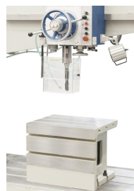
Präzisionsgelagerte Spindel für exakte Arbeitsergebnisse, Würfeltisch und Kühlmittleinrichtung im Lieferumfang enthalten.