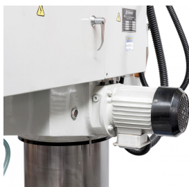
Serienmäßiger Hydraulikmotor für die Klemmung des Auslegerarms und des Bohrkopfes